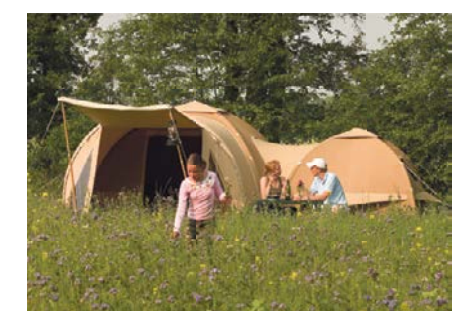
De Karsten Koppeltent Dan zet je echt wat neer