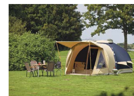
De Karsten Tent 300 De beste oppompbare tent