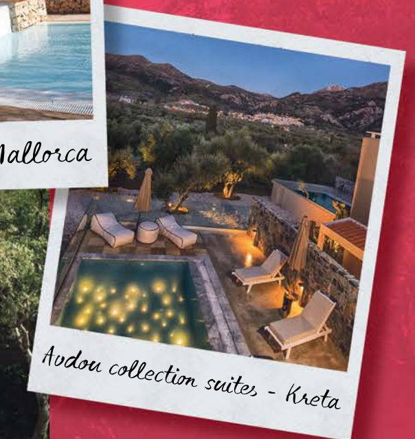
Ardou collection suites - Kreta

Waar iedereen rechts afslaat, gaat Eliza linksaf