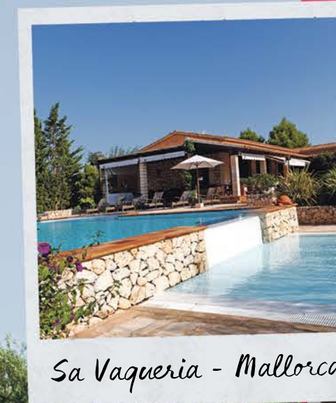
Sa Vaqueria - Mallorca