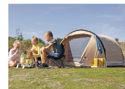
De Karsten Novia Een stevige bijzetter