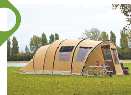
De Karsten Lacerta Verrassend flexibele gezinstent

Bezoek onze site of kom langs in onze nieuwe showroom.