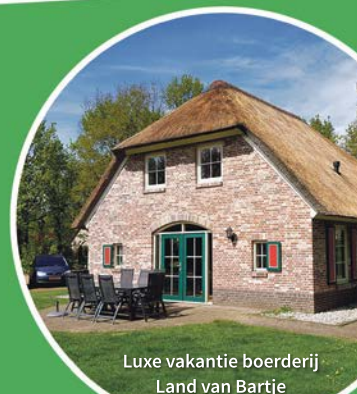
Luxe vakantie boerderij Land van Bartje